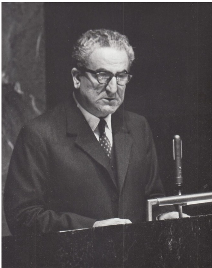
Charles Habib Malik

Poslední významnou poznámku pak pronesla žena – indická zástupkyně Hansa Mehta (1897 – 1995). Zeptala se, zda-li je nutné, aby francouzský návrh zdůrazňoval rovnost „homme“, nebylo-li by lepší přijmout rovnost „lidí“.