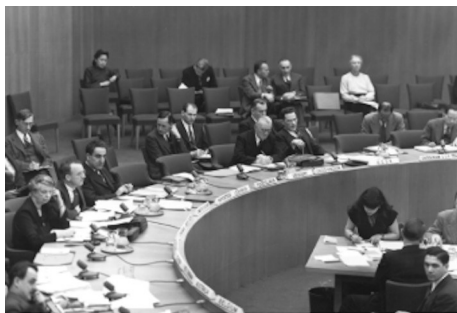
První zasedání Komise pro lidská práva

První návrh „mezinárodní“ listiny práv předal kanadský metodista a předseda Komise John P. Humphrey (1905 - 1995). Vycházel ze stručných Listin práv USA nebo Virginie. Stručný výčet pak „po francouzsku“ přepracoval na druhém jednání komise Francouz židovského vyznání René Cassin (1887 - 1976). Sám těžce raněný kulometnou dávkou roku 1916 využil francouzskou Deklaraci práv člověka a občana a s vědomím všeobecné platnosti základních práv je více rozepsal a precizoval; nyní návrh již Všeobecné deklarace základních práv a svobod získal i Preambuli.